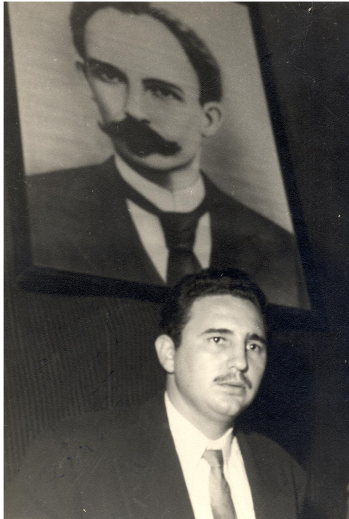
Fidel Castro junto a la imagen de Martí, EE. UU., 1955.

Keywords: disciple, master, revolution, continuity, anticolonialism.