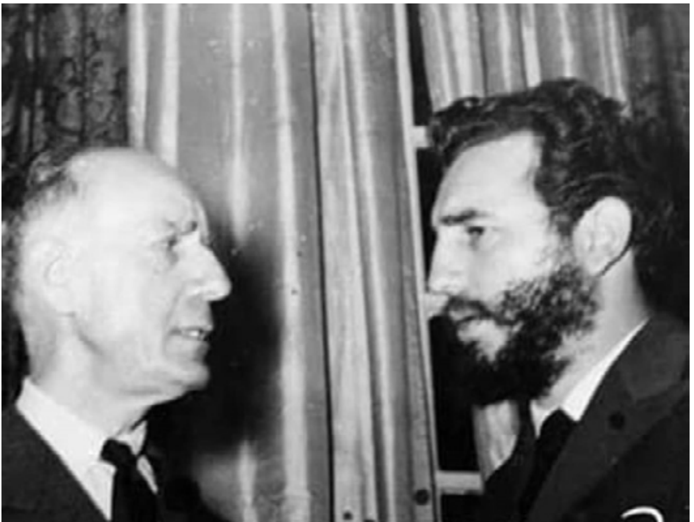
Herbert Matthews conversa con Fidel, en la embajada de Cuba en Washington, después de ser condecorado (abril de 1959).

Sin embargo, la relación con Matthews trascendió esta entrevista fundacional y se erigió como el primer caso emblemático de una estrategia más amplia. Fidel comprendió que los periodistas de alto rango estadounidenses podían, además, funcionar como canales de comunicación indirectos con el liderazgo estadounidense, sirviendo para trasladar mensajes y actualizarlos con percepciones actualizadas sobre la realidad cubana. En este marco, sus estructuras de comunicación política fueron responsabilizadas