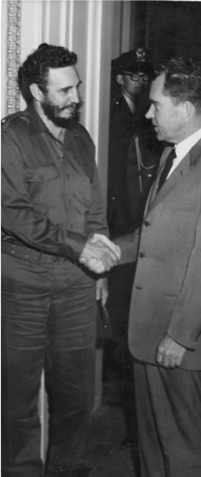
Fidel y Nixon, Estados Unidos, 1959.

fabricación estadounidense que se traficaban desde la Base Naval de Guantánamo.