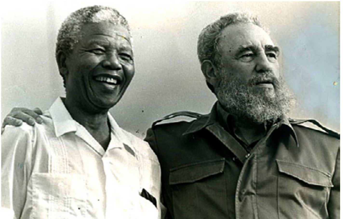
Fidel y Mandela en Cuba.

forma directa o indirecta, una red de relaciones al interior de Estados Unidos que le permitían un intercambio directo y una retroalimentación con diversos sectores de esa sociedad.