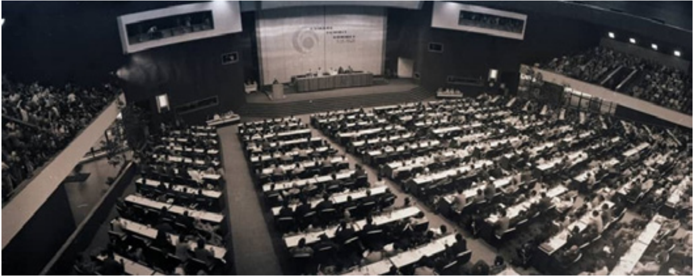
Escenario de la VI Cumbre MNOAL, Habana, 1979.

iniciales y fomentar la neutralidad cómplice del imperialismo.