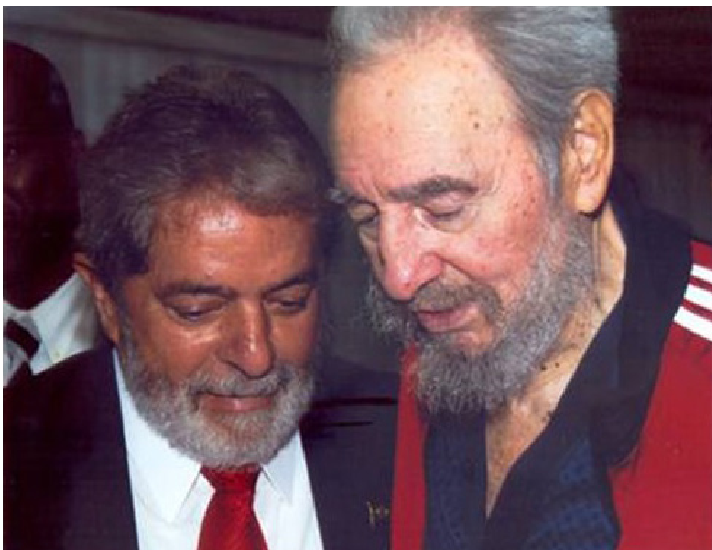
Lula visita a Fidel, en La Habana.

Comandante , muestra a un Fidel deliberadamente alejado de los grandes discursos multitudinarios, optando por un formato de conversación sosegada que lograba una vez más humanizar su figura ante los espectadores internacionales y particularmente, los estadounidenses. Stone estructuró el documental como una serie de diálogos filosóficos, donde