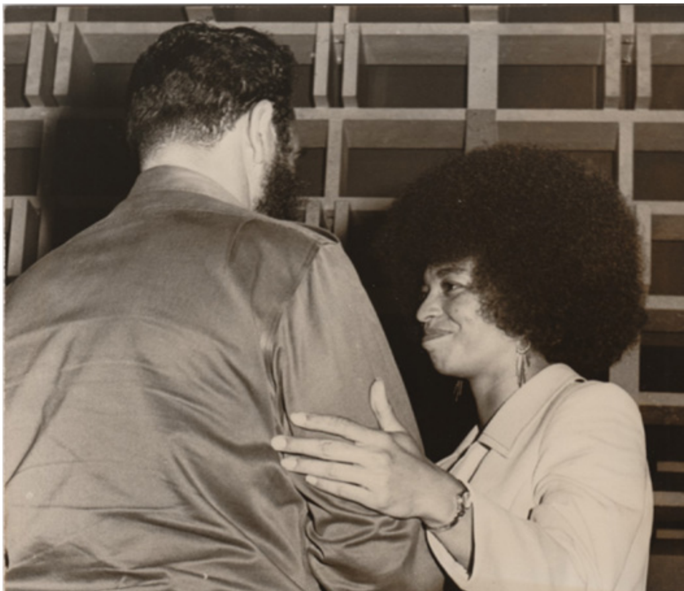
Fidel condecora a Angela Davis en Cuba.

Después de garantizar un conocimiento diverso sobre cada fenómeno, revisó la causalidad de lo sucedido una y otra vez, puso el principio en el fin, y viceversa. Contrastó siempre el hecho en sí con el devenir histórico y lo proyectó hacia el futuro, una y otra vez.