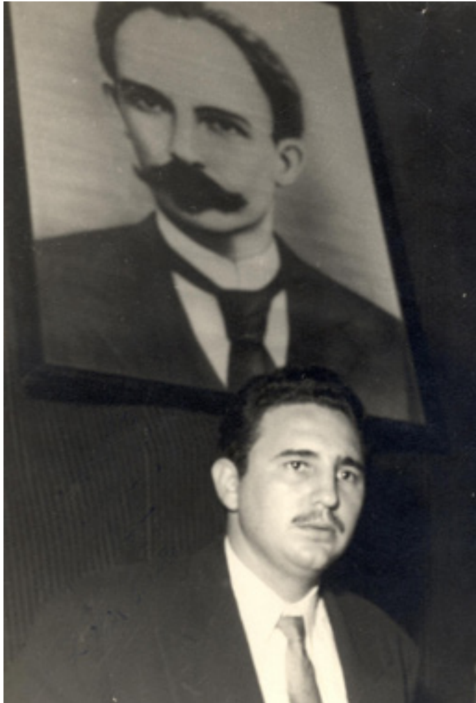
Fidel Castro junto a la imagen de Martí, EE. UU., 1955.

Bajo el liderazgo de Fidel, discípulo indiscutible de Martí, surgieron nuevas batallas que conllevaron al triunfo revolucionario de 1959. Sirva este trabajo como digno homenaje a ese discípulo, que en el año