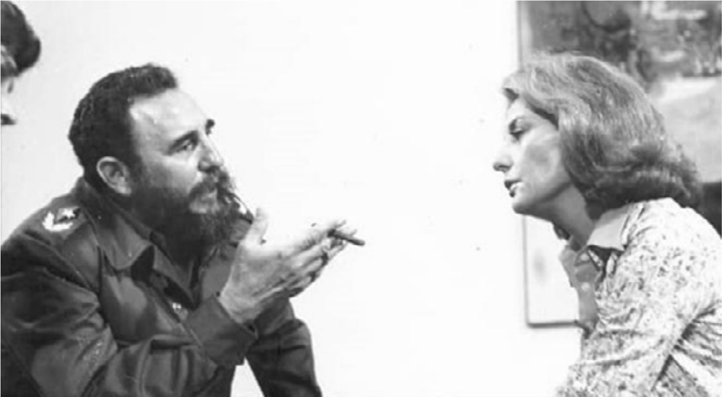
Fidel y Barbara Walters, durante la entrevista concedida en La Habana, el 19 de mayo de 1977.

grandes medios estadounidenses y particularmente a The New York Times .