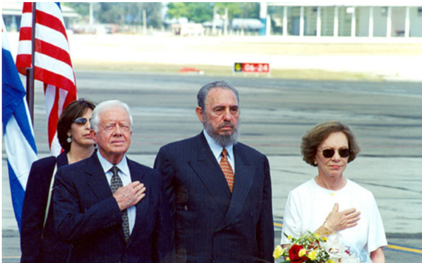
Expresidente James Carter y Fidel en Cuba, 2002.

A lo largo de 1977 y 1978, ambos gobiernos establecieron "Secciones de Intereses" en las embajadas de terceros países (Suiza en La Habana y Checoslovaquia en Washington), que funcionaron como embajadas de facto.