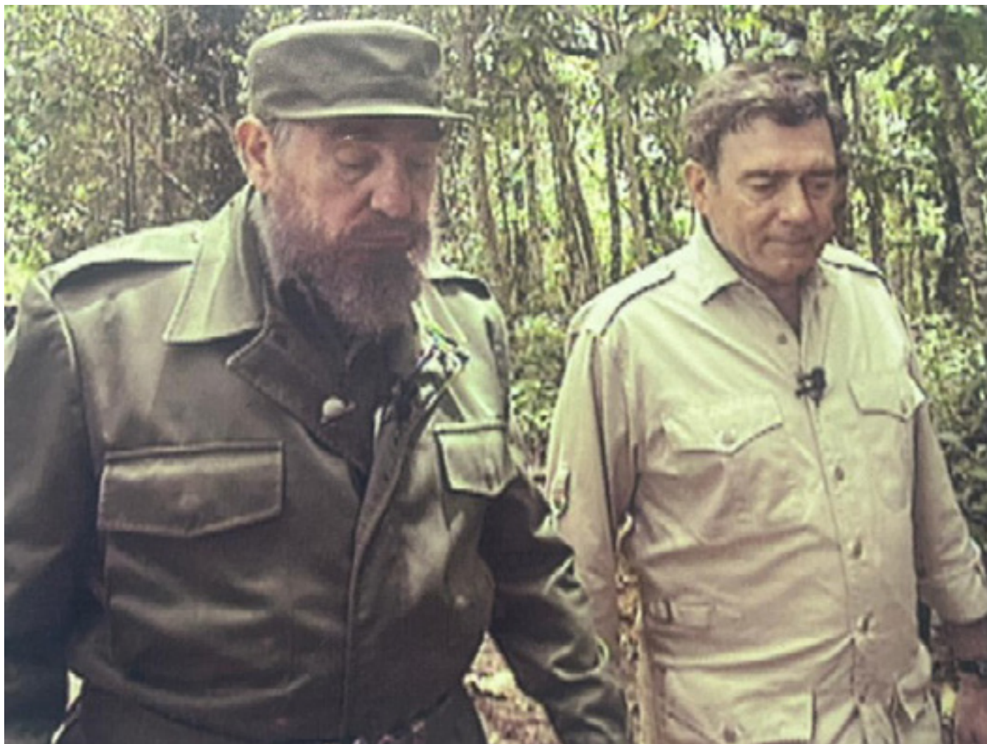
Fidel junto a Dan Rather (1996).