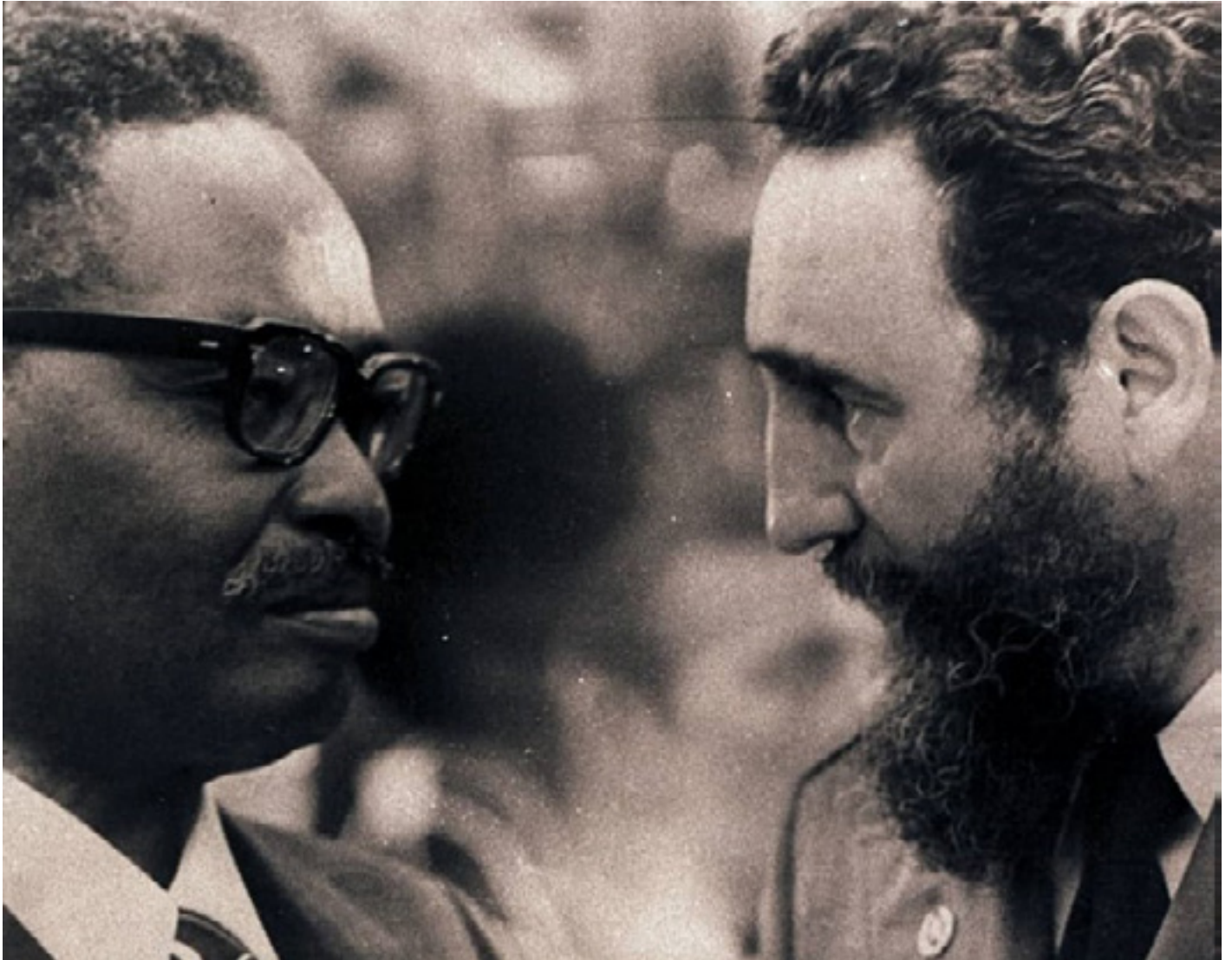
Neto junto a Fidel.

y herencia nacional cubana, Fidel Castro (1998) enfatizó la importancia del continente, ya que "sin África, sin sus hijos y sus hijas, sin su cultura y sus costumbres, sin sus lenguas y sus dioses, Cuba no sería lo que es hoy".